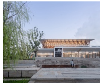
Xitang Naera Art Gallery.