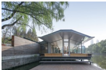
Deep Dive Rowing Club.