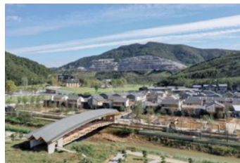
Bridge of Nine Terraces.