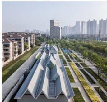
Activity Homes at Yunjin Road.