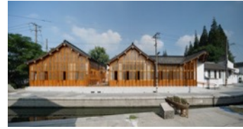
Shengli Street Neighborhood Committee and Senior Citizens' Daycare Center.