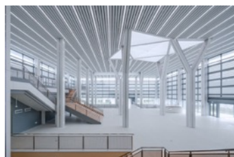
Pudong Adolescent Activity Center and Civic Art Center. © Zhu Runzi