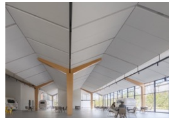
Xitang Naera Art Gallery. © Liang Shan