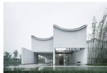
Dongyuan Qianxun Community Center.