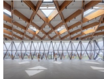
Xitang Naera Art Gallery.