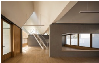
Activity Homes at Yunjin Road.