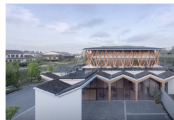
Xitang Naera Art Gallery.